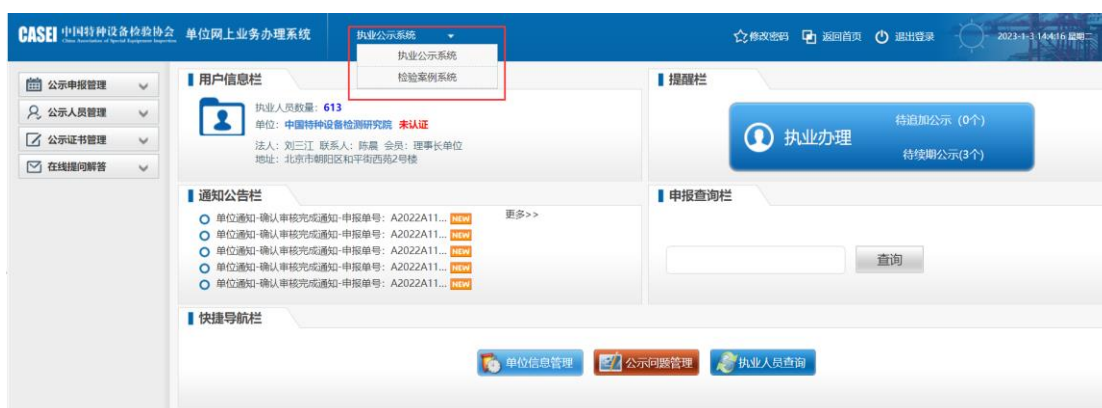
(如图：单位拥有检验案例系统权限的业务账号登录效果)

检验案例管理菜单下包含检验案例的新增、修改、删除、查看，以及对检验检测人员上报的检验案例进行审核，审核功能支持批量。并且支持 excel 批量导入。